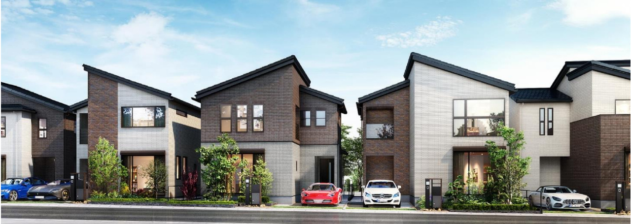
※「ウィザースガーデン市川菅野」街並み完成予想図

京成本線「菅野」駅から徒歩6～7分、全20邸の新築一戸建てプロジェクト「ウィザースガーデン市川菅野」は、全邸に落ちつきと品格を醸し出す外壁タイル貼りを採用し、美しい街並みを形成します。また、毎日の暮らしを上質にする設備・仕様、そして空間デザインを採り入れたプランニングにより、末永く快適な暮らしをお約束します。