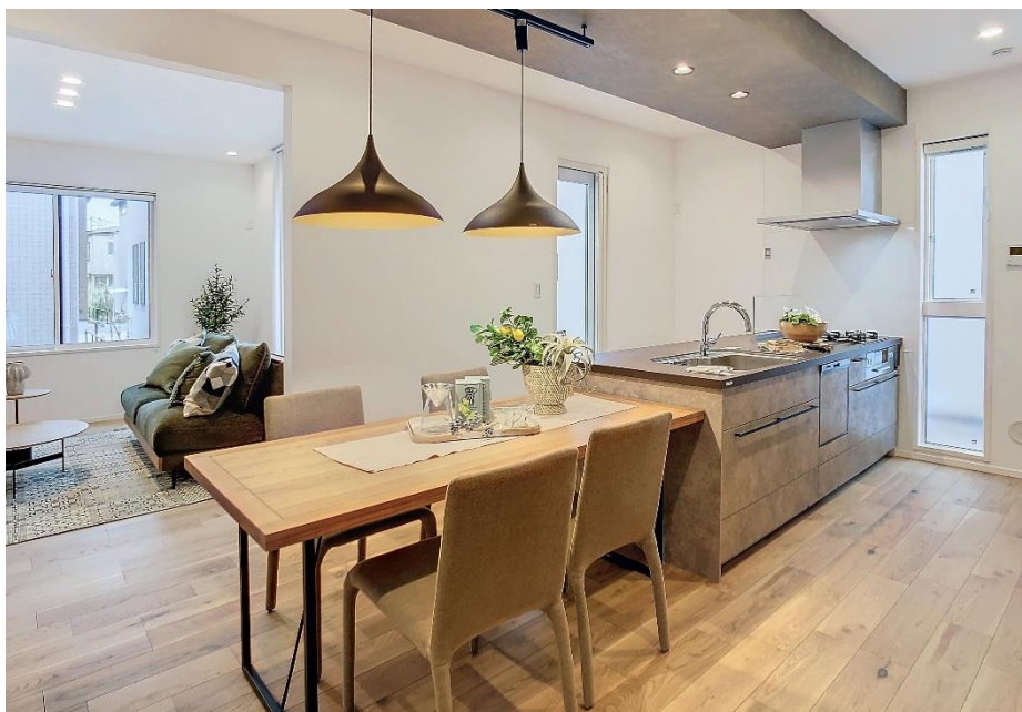
※モデルハウス内観

ウィザースガーデンでは、日々の暮らしを上質なものにするために、光、風、温度、家事、自分時間などをテーマに、室内外に多彩な工夫、最新の設備・仕様を採り入れています。