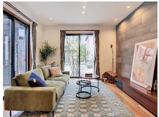
※モデルハウス：リビング

開放的なキッチンを中心に、サニタリールーム、ホール（玄関）、リビング・ダイニングに回遊性を持たせ、忙しい共働き夫婦の家事負担を軽減するスムーズな生活動線を実現。リビングとダイニング両方からつながる広々としたウッドデッキは、自然とのつながりを満喫することができる贅沢なアウトドアスペースです。また、屋根のあるスペースがあるので、椅子やテーブルを置いて、ゆったりとした時間を過ごすこともできます。さらに、子育て世帯を想定したツードアワンルーム設計の 2 階洋室は、間仕切りをすることで、将来のライフスタイルの変化にも対応できるフレキシブルさが特徴です。